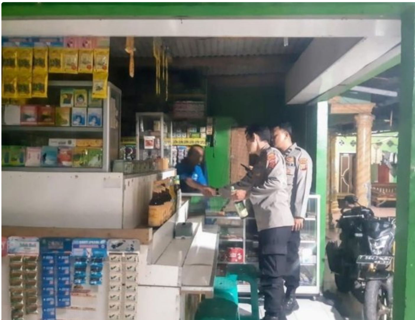
Anggota Polsek Tirtajaya Gencar melaksanakan Razia Miras Oplosan diwilayah Hukum Polsek Tirtajaya

Polres Karawang Polda Jabar, - Polsek Tirtajaya Polres Karawang Polda Jabar,